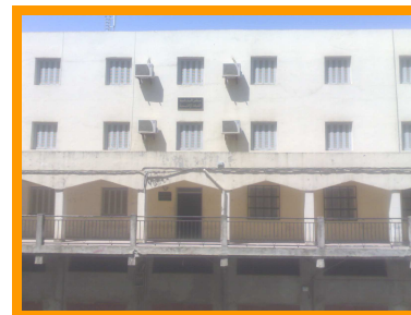
Siège de l'Agence de Tizi-Ouzou (RDC)

Ces réalisations viennent renforcer la place du CTC-Chlef parmi les contrôleurs de la construction et marquent sa volonté de parfaire ses interventions en étant proche de ses partenaires sur le terrain.