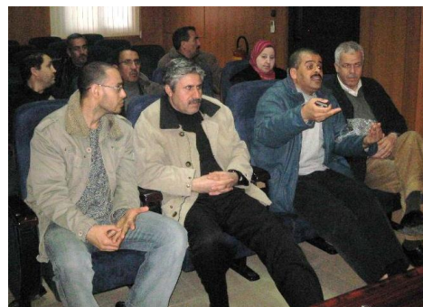
Quelques photos de la rencontre.